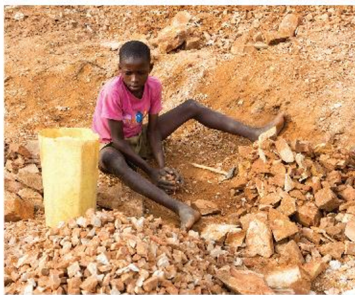
▶ En Uganda, gran parte de los trabajos son realizados por niños, quienes son privados de sus derechos fundamentales.

Cada año, más de 100 médicos de Malaui se inscriben para trabajar en Gran Bretaña mientras que en su país hay solamente 120 médicos para una población de 12 millones de habitantes. De este modo, la migración de trabajadores cualificados jóvenes representa una pesada carga sobre una zona que cuenta con capital humano ya escaso. Francia, Gran Bretaña y Estados Unidos acogen a casi la mitad de la diáspora del África subsahariana en la actualidad.