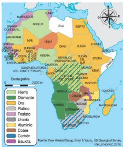
Principales recursos mineros de África.

Los principales países inversores en territorio africano son China, Francia y Gran Bretaña. Con modalidades diferentes, generan un neocolonialismo que, si bien no radica en la imposición de su gobierno, cultura o religión, como sucedía en el siglo XIX, su dinámica extractivista coloca a los Estados africanos en un lugar de dependencia política y económica.