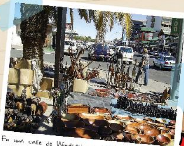
▶ En una calle de Windhoek, es posible reconocer marcas culturales que responden a distintos orígenes.

La despedida de Namibia fue un domingo, desde la ventana del avión saludé al país que vive una independencia joven y lucha por su identidad como nación.